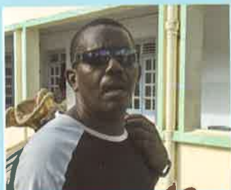
Sisi percussion était lui aussi venu soutenir cette manifestation.

La Mi-Carême, un moment de rencontre et de partage. Les personnels de Pavlov, Pinel et Esquirol ont conjugué proximité et tradition pour que toute la communauté hospitalière se retrouve dans ce nouvel espace, "les Jardins d'Esquirol".