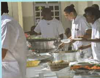
Une équipe organisée et mobilisée pour cette manifestation!