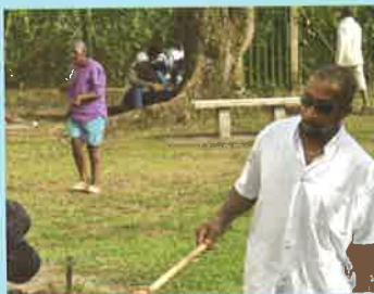
Un méchoui! Tous ceux qui étaient présents se sont régalés!